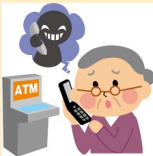
消費者被害の防止